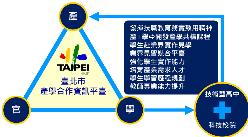
圖 4、臺北市推動產學合作計畫架構

因應身心障礙學生於技術型高中畢業後有就業意願的需求，以實用技能學程課程為基礎，規劃就業導向課程，創新於技術型高中辦理「專業技能班」(屬集中式特殊教育班型)，提供大量業界實作、見習及實習課程，輔以檢定證照訓練及特殊需求領域課程，以深化就業及適應未來生活所需能力。