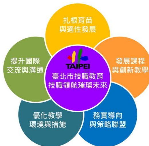
圖 2、臺北市技職教育發展願景

臺北市技職教育政策之推動，將以系統性的思維、整體的規劃及完善的配套措施建構發展願景，如圖 2 所示。培養孩子在專業知識理論外的「非認知能力」，未來強調非認知部分的教育重點，包括跨域及統整運用，掌握方向及目標。